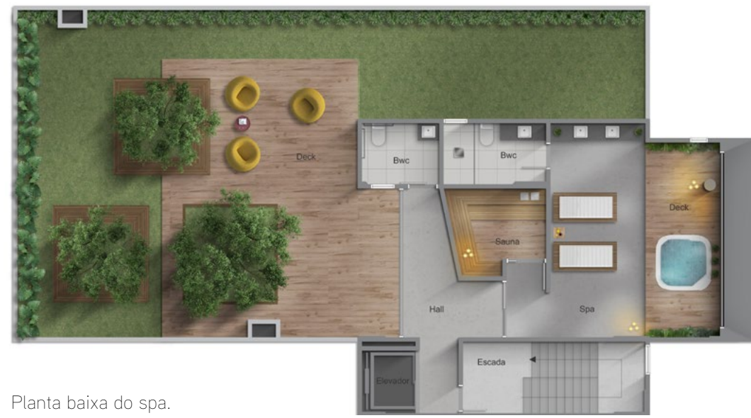
Planta baixa do spa.