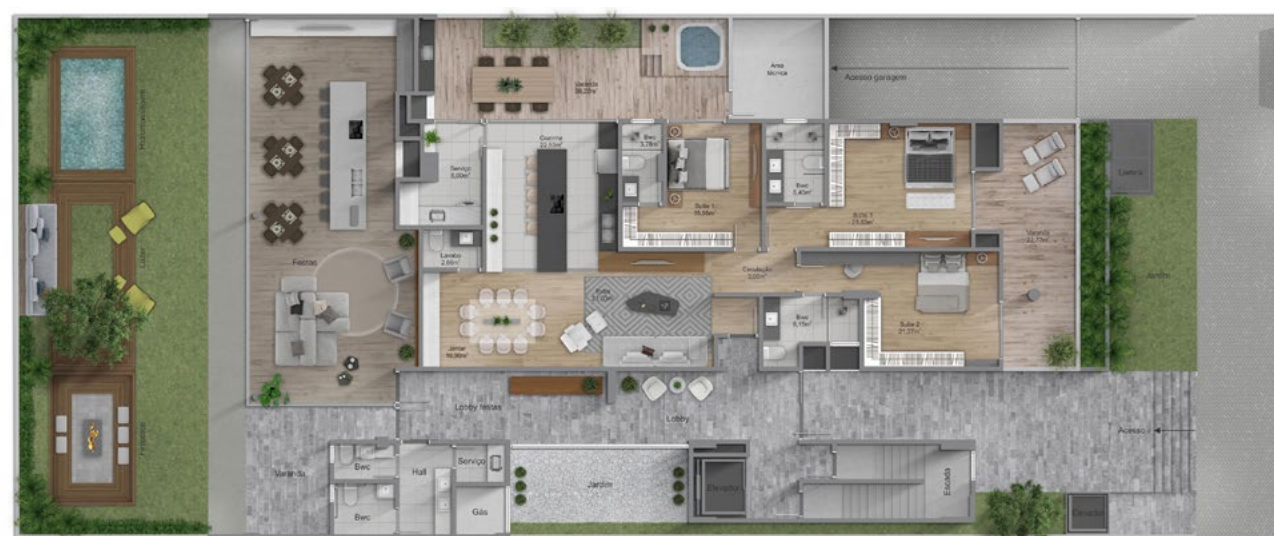
Planta baixa do térreo